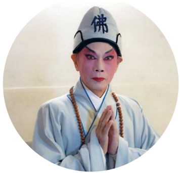
羅家英 飾 六祖惠能大師