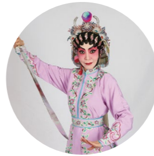
王超群 飾 秀娟

1988 年，與汪明荃創辦福陞粵劇團，以傳承傳統技巧，並開蕪新風格為宗旨，推廣粵劇文化。他先後於 2012 年及 2018 年獲香港特別行政區政府頒發「榮譽勳章」及「銅紫荊星章」，表揚他在推廣粵劇藝術工作上的貢獻。2019 年起，任職西九文化區戲曲中心茶館劇場的藝術策劃及茶館新星劇團的導演。